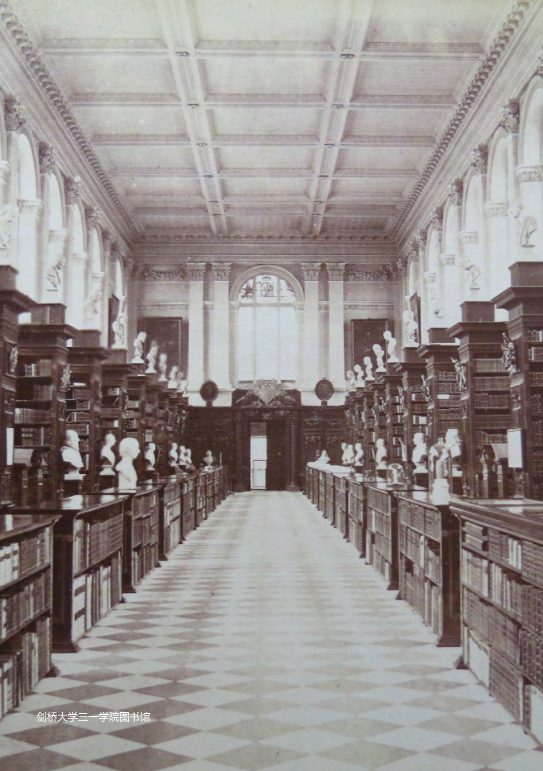
剑桥大学三一学院图书馆